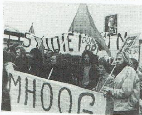
BEURZEDEMONSTRATIE MAART 1971

Het resultaat wordt ronduit bedroe- vend wanneer we de schrale f 5660,- van De Brauw vergelijken met het reële budget van de studenten : f 8860,-. De konklusie is duidelijk.