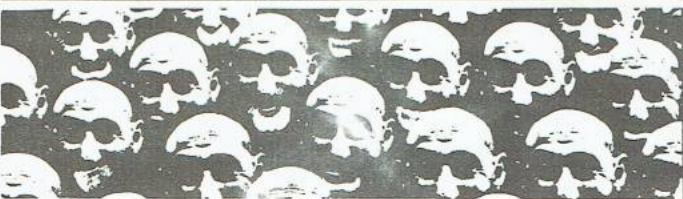
volle collegebanken; studeren na 20 jaar wachtlijst....

Aan de Economische fakulteit zijn een aantal studenten van de fakulteitsgroep dit studiejaar gestart met projektonderwijs. Voor deze studie-inhoudelijke activiteit is van het begin af aan geprobeerd compensatie te krijgen in het studieprogramma. Op de laatste vergadering van de fakulteitsraad werd na intensieve voorbereiding door de studenten een aantal marges voor projektonderwijs gerealiseerd binnen de huidige studie. Ondanks pogingen van een aantal hoogleraren en medewerkers om bij de geboorte van het projektkind gelijk de armpjes, beentjes en het hoofdje af te kappen, hebben de economiestudenten enige ruimte gekregen. Ze kunnen nu zowel in hun kandidaats- als in hun doctoraalstudie deelnemen aan projektonderwijs. (Mensen van de fakulteitsgroep Economie - die elke donderdagavond om 8 uur in de Hooglerarenkamer, OB 23 vergadert - hebben de specifieke gegevens keurig op een rijtje in hun hoofd.)