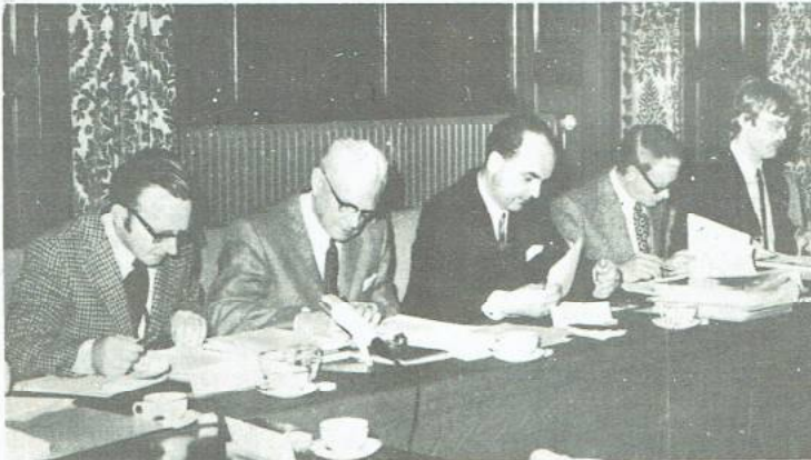
..bestuurders die niet onder democratische controle staan..

roep te doen op het eksperimenterartikel zonder al tot WUB-raad omgeknutseld te zijn en eenheid in de aksie met grote delen van TAP en staf. (Denk b.v. maar aan de solidariteitsverklaringen van de ABVA en de WVO-afdeling Groningen). Maar laten we niet de vergissing maken te denken dat we de WUB al buiten de deur hebben: zo zijn met name de subfakulteiten psychologie en peda-andragogie nog niet