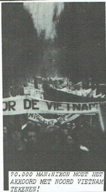
70.000 MAN: NIXON MOET HET AKKOORD MET NOORD VIETNAM TEKENEN!