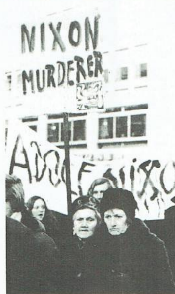
Ook ouderen nemen geen blad meer voor de mond. Getuige deze foto die werd gemaakt tijdens de demonstratie in Groningen op 30 december.

en andere NATO-landen ontwikkelde zenuwgassen. Via personele relaties en onderzoekssubsidies zijn vele Universiteiten nauw betrokken bij RVO onderzoek. In 1971 werd subsidie verleent aan: -onderzoek over Antropogenetica, voor 6 werkgroepen aan de Universiteiten van Groningen, Leiden en Nijmegen i.s.m. het Mediesbiol. Lab. RVO. bedrag: f270.500. -onderzoek Neurofarmacologie, voor 8 werkgroepen aan de Universiteiten te A'dam(GU), Groningen, Leiden, Nijmegen, Utrecht en de Mediese Fakt. te R'dam i.s.m. het Mediesbiol. Lab RVO-TNO. De NAVO-beurzen van ZWO '71 werden verleend aan wetenschappers die allemaal naar de VS vertrokken (1 naar Brussel). Er was ook een medewerker van de TH Eindhoven bij. In Eindhoven wordt echter onderzoek gedaan naar vuurleidingsapparatuur voor Defensie! Het is allemaal een ingewikkeld zaakje. Maar vast staat dat op de Universiteiten indirect een bijdrage geleverd wordt aan de VS-oorlog in Vietnam. M.V.