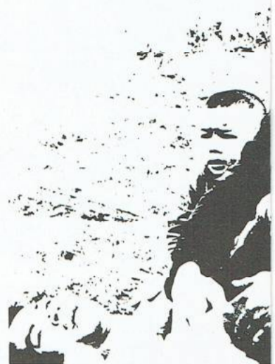
Het landelijk comité, dat de heeft georganiseerd beraadt z nieuwe mogelijkheden voor aks op richt is de zo massaal moge affiche met het opschrift "Nix de demonstranten in Utrecht. Ook op het GSb-kantoor zijn de De prijs daarvan bedraagt 2 g stemd voor het Medisch Comité