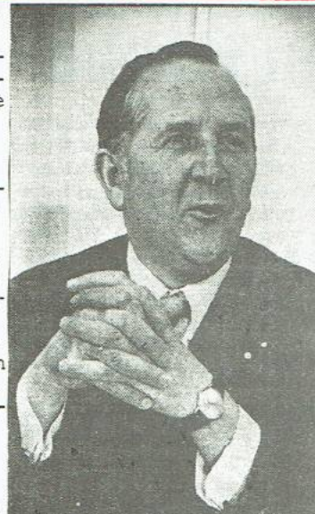
- deze 'vriendelijke' CHU-minister schuwt de intimidatie van personeel en studenten niet.