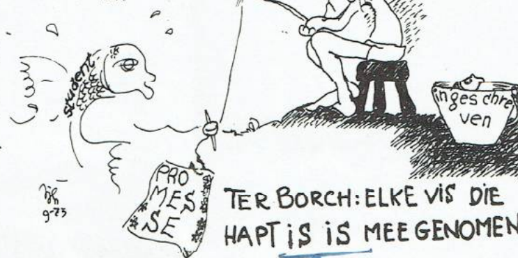
TER BORCH: ELKE VIS DIE HAPT IS IS MEE GENOMEN

grote groepen studenten, de posthumuseringstendenzen en de navordering, de hoogte van het bedrag, dat weliswaar een tegemoetkoming is aan onze eisen, maar geenszins een inwilliging van onze eis 'volledige intrekking van de f 1.000 wet' is, dit voorstel van Klein afgewezen worden.