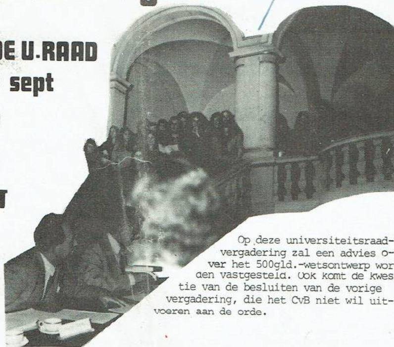
Op deze universiteitsraadvergadering zal een advies over het 500gld.-wetsontwerp worden vastgesteld. Ook komt de kwestie van de besluiten van de vorige vergadering, die het CvB niet wil uitvoeren aan de orde.