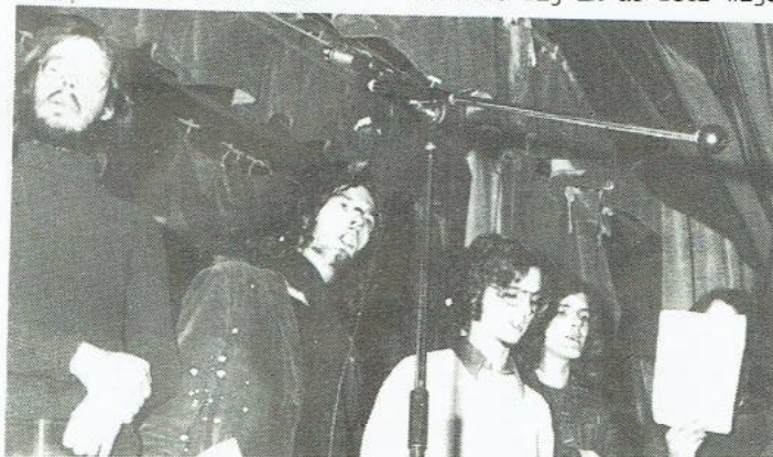
...Voorwaarts in 1972...