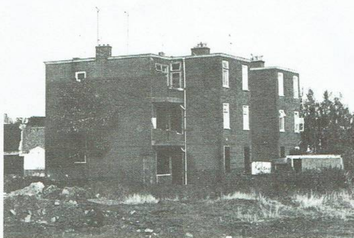
... strake tegen de vlakte ...

voor de studentbewoners, was inmiddels ingewilligd. Maar daar had de gemeente dan ook weinig mee te maken. Dat was meer een zaak tussen de SSH, Centraal Woning Beheer en de studentbewoners.