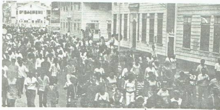
... stakingen in Suriname, 1973 ...

Het doel van de volkskomitees is in de eerste plaats het verhogen van het politiek bewustzijn van de surinaamse bevolking en het vergroten van haar zelfvertrouwen. Dit is noodzakelijk om het surinaamse volk in staat te stellen in georganiseerd verband zelf in te grijpen in haar leefsituatie en strijd te voeren tegen alle vormen van uitbuiting en onderdrukking en vóór vestiging van een socialistische maatschappij. Dit doel is echter niet zo maar, zonder meer te verwezenlijken. "Mensen gaan in eerste instantie niet vechten voor ideeën, de dingen in iemand zijn hoofd", zoals Amílcar Cabral, de vermoorde leider van de PAIGC, de revo-