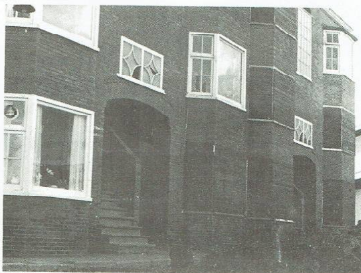
... Houtzagerstraat, gedeeltelijk ontruimd ...

Er werd opgelucht de toezegging gedaan, dat zo snel mogelijk een overleg zou plaatsvinden tussen de gemeente, de stichting studenthuisvesting en de bewoners over deze eisen. Opgelucht, omdat de Houtzagerstraat geen officiële bezwaren tegen de plannen zou indienen; voor de gemeente was de weg vrij en voor de bewoners leek een gunstig klimaat voor de onderhandelin-