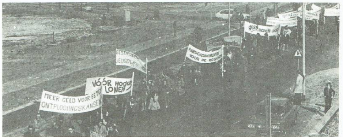
... in maart '73 werd in Winschoten gedemonstreerd tegen de werkloosheid ...

aangeeft dat ontslagen nodig zijn. Bij Müller is nu een aktiekomitee opgericht om de ontslagen tegen te gaan. Het komitee tegen de werkloosheid is van mening dat bedrijven niet gesloten mogen worden, dat er niet meer mensen ontslagen mogen worden. Desnoods zal de regering met steunmaatregelen moeten komen, om de werkgelegenheid te behouden. In dit verband wijst het komitee er op dat maar al te vaak ten onrechte arbeiders ontslagen dreigen te worden. Zo werd enige jaren geleden nog gezegd dat de strokarton