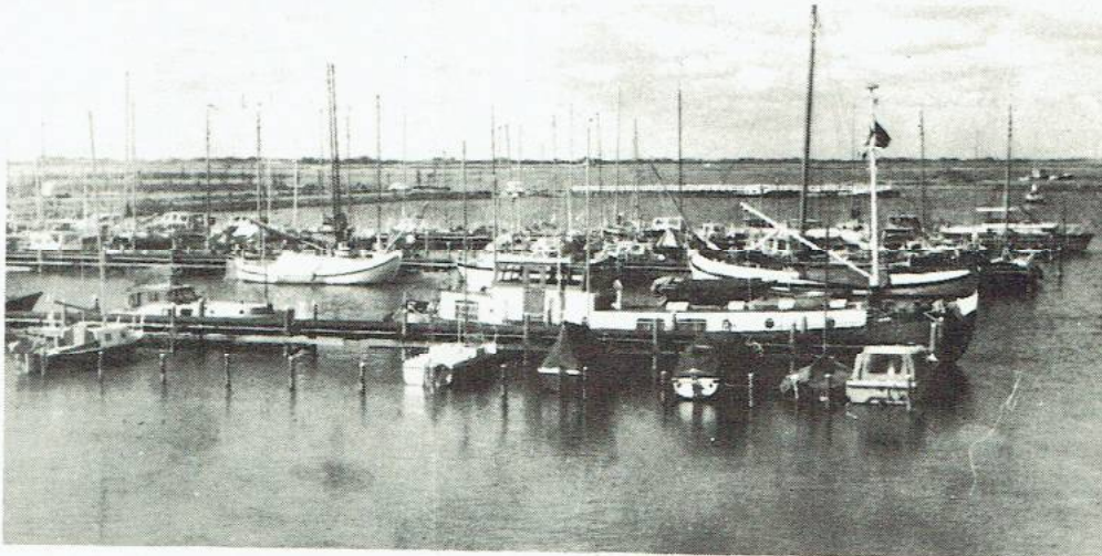
rekreatie in Lauwersmeer, bedreigd door oefenterrein

Op 16 december is in Lauwers- oog het Aktiekomitee Lauwers- meer opgericht. Reden van de oprichting van bewoners van het Lauwersmeergebied over de plannen die het ministerie van defensie heeft met dit gebied, nl. de vestiging van een militair oefenterrein. Wat zijn deze plannen? Het blijkt dat een gedeelte van het Lauwersmeergebied geschikt gemaakt wordt voor oefeningen op grote schaal en dat er ook tanks zullen rond rijden. Achter de dijk zullen schietbanen worden aangelegd en de afzwaaiende granaten zullen tot 6½ kilometer buiten de dijk op het wad vallen waar de vissers uit Lauwers- oog garnalen vangen. Tot ong. 6 kilometer van het schiet- terrein 't Harde Klagen bewo- ners over het lawaai. Soms val- len lampen van het plafond en schuren muren. Verdere over- last wordt verwacht van de straaljagers, die aan de oefen- ingsen gaan deelnemen. Verschillende bevolkingsgroep- en hebben hun bezwaren tedi- t oefenterrein. Deze zijn: 1. Dit oefenterrein betekent een ernstige aantasting van de woon- en werkgelegenheid in de streek. De bewoners zul- len ernstige last ondervinden van de geluidshinder door schietoefeningen en straalja- gers. 2. De vissers zullen geschaad worden door de onveilige zō- ne ten Noorden van de dijk (6½ km.). De schelpenvisserij zal prakties ophouden te be- staan en ook de garnalenvis- sers verwachten ernstig te worden gedupeerd.