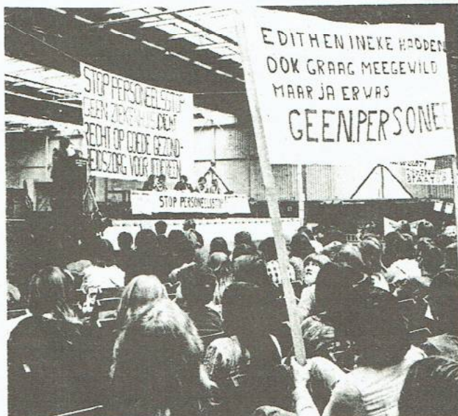
akties tegen de personeelstop in de gezondheidszorg

vaar lopen. De heren Van Kemenade, Klein en de Jong Ozn. zijn in navolging van de West-duitse plannen voor verlaging van de ambtenaren salarissen van plan ook de inkomenspositie van het Nederlandse onderwijzend personeel aan te tasten. In navolging van de verlaging van de salarissen voor hoogleraren, student-assistenten en jonge aankomende wetenschappelijke medewerkers zullen meer werkers eraan