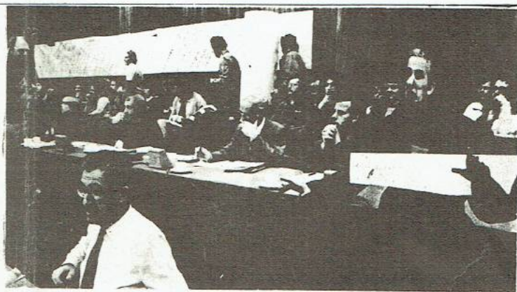
AKTIE STUDENT-ASSISTENTEN DELFT

Mogelijk ontslag 700 student-assistenten.