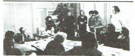
verklaring voor het CvB