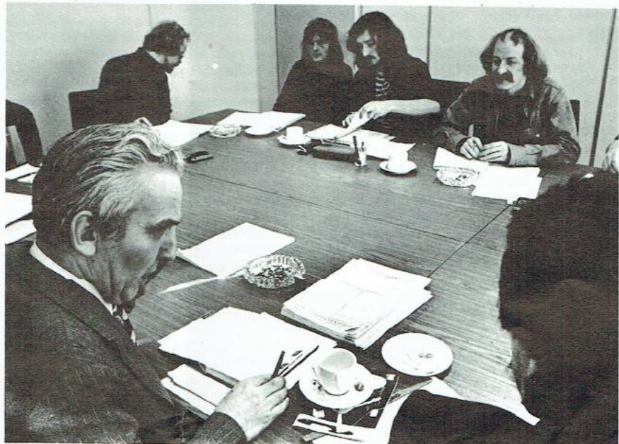
LOG-delegatie rond de tafel met staatssecretaris Klein, 4 februari jl.