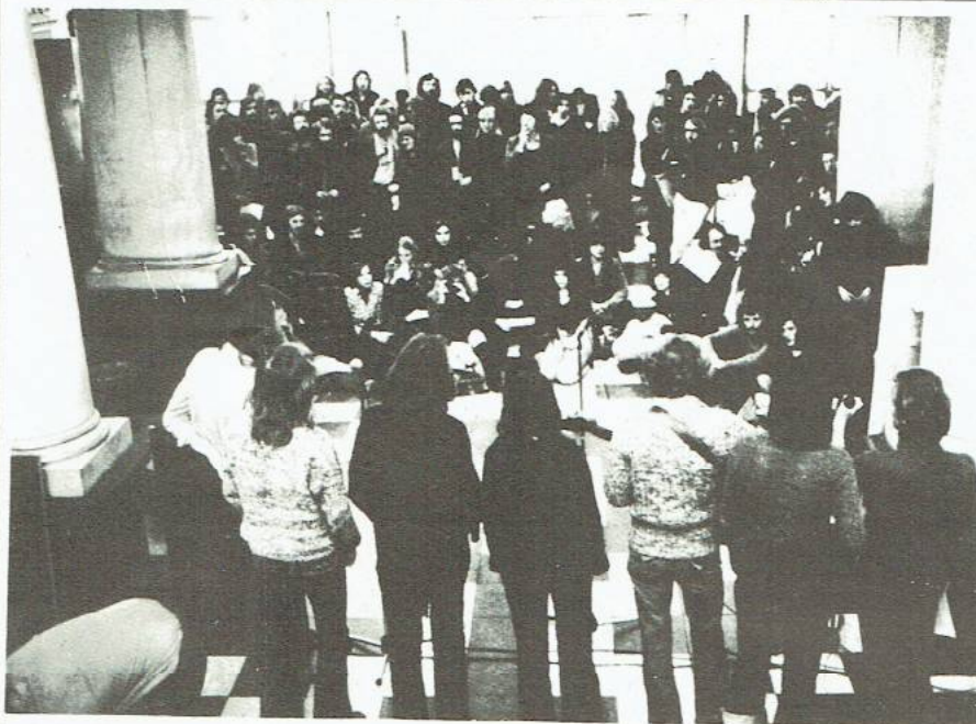
MEETING VOORAFGAAND AAN DE U-RAAD MET OPTREDENS VAN VOORWAARTS EN GL-TWEE

gaan bestaan uit vertegenwoordigers van de faculteiten, zodat van die zijde invloed mogelijk blijft, echter het gevaar voor het tegen elkaar uitspelen van de vacatures zeer groot is. Daarnaast zijn het College van Bestuur en Personeelszaken vertegenwoordigd. Als belangrijk uitgangspunt bij de behandeling van de verschillende vacatures werd vastgesteld, de mate waarin een vacature knelpunt is; daar bij zal zeer nadrukkelijk gete worden op de gevolgen voor personeel,