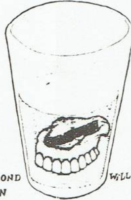
MET DE MOND BELIJDEN

We herinneren ons de handtekeningactie van de Gsb voor een universitaire tandheelkundige dienst. Dat was oktober.