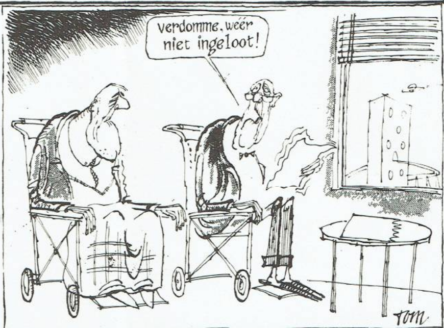
academische raad adviseert 11 numeri fixi voor volgend jaar

"Als Gsb proberen we, tegen de bezuinigingen in, toch nog een goed beleid te voeren. Dat wil bij ons zeggen dat we alles op alles zullen zetten om het onderwijspeil aan de universiteit te garanderen, en liefst nog te verbeteren. Wat ongetwijfeld een belangrijk punt gaat worden zijn de studentenstops. OP het ogenblik adviseert de academische raad om maar liefst elf stops in te stellen. Het is nog niet geheel duidelijk of de staatssecretaris dat advies inderdaad overneemt. Wat je wel ziet is dat zo langzamerhand de genele Letterentaculteit dreigt dicht te gaan. Ik denk dat dit aspect van de bezuinigingen - het indammen van de studentenaantallen om toch maar met minder middelen rond te kunnen komen - volgend jaar erg belangrijk gaat worden. De verkiezingscampagne voeren we dan ook onder het motto: "sta op je onderwijs, stem Gsb" om duidelijk te maken dat het ons gaat om goed onderwijs voor zoveel mogelijk mensen."