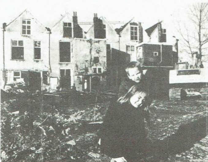
ZIJ WILLEN OVER TIEN JAAR OOK EEN KAMER; MAAR HOE ZIT HET MET DEGENEN DIE MET INGANG VAN 1 AUGUSTUS EEN KAMER WILLEN; ZIJN KRAAKAKTIES NODIG ?

Hoe kunnen de aankomende eerstejaars rekenen op een dak boven hun hoofd? De feiten wijzen erop dat een grote kamermood dreigt. Met een kamer bedoelen we dan een basisvoorziening, hoe vreemd dat bepaalde instanties, en dan met name het CvB en de gemeente, ook in de oren zal klinken. Een basisvoorziening geldt niet alleen de vier muren om je heen met een vloer onder en een plafond boven, maar ook de afstand van die delen tot elkaar (de grootte van de kamer) en andere noodzakelijke voorzieningen en beschermende factoren (geen kieren) die een redelijk studeren mogelijk (niet onmogelijk) maken. Want daar gaat het tenslotte om: tentamens en punten halen. Klinkt vreemd in de oren van sommigen, gezien de zekere onverschilligheid waarmee dit dreigend probleem voor vele eerstejaars benaderd wordt. Tenminste als het gaat om de bereidwilligheid snel maatregelen ter oplossing daarvan te treffen. Mocht de gemeente wat dit betreft haar verantwoordelijkheid in twijfel trekken, door de positie van de student