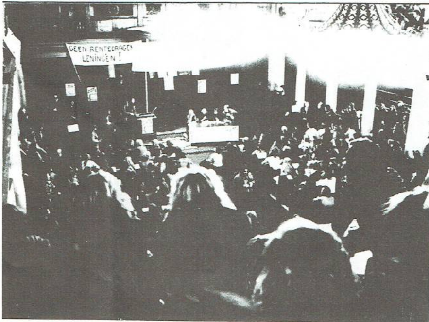
DIVERSE MALEN GINGEN STUDENTEN DE STRAAT OP OM TE DEMONSTREREN TEGEN HUN SLECHTE FINANCIËLE SITUATIE? ZOALS HIER OP 18 SEPTEMBER J.L. ONDANKS DE RECENTE BIJSTELLING, BLIJFT DE SITUATIE WEINIG ROOSKLEURIG, WANT HOE STAAT HET MET JOUW GELD, MET JE VAKANTIE, OF EVENTUEEL EEN VAKANTIEBAAN? HOE STAAT HET ECHTER MET DE MOGELIJKHEDEN VOOR VAKANTIE WERK?

van de normen voor de ouderlijke bijdrage, moet de verhoging van de maximale toelage teleurstellend genoemd worden, omdat het verhogingspercentage van 7,2 procent achter blijft bij de prijsstijgingen van het afgelopen jaar (8,5 procent). Dit betekent, dat de studietoelages reëel met f100,- achteruitgaan.