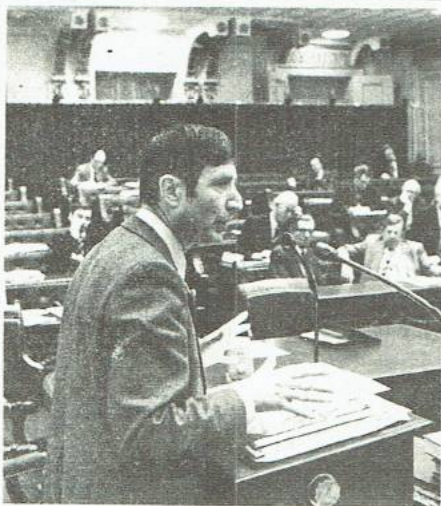
Dries van Agt.

Het was verleden week zaterdag een geslaagde demonstratie. De vijfduizend deelnemers eisten, dat de vrouw over abortus zelf moet beslissen, zonder dat de minister van justitie op de loer ligt om iemand in de kraag te grijpen. Door de Kalverstraat klonken de eisen "Abortus vrij, abortus in het ziekenfonds, dat eisen wij" en "Tien zetels winst voor de PvdA, en nog loopt Den Uyl Van Agt achterna". Veel toeschouwers brachten de stoet demonstranten een ovatie. Een demonstratie die zijn uitwerking niet zal missen.