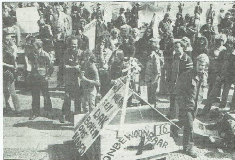
Aktie op Grote Markt.