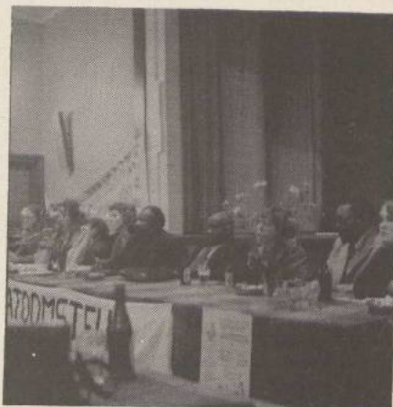
Achter de tafel de ANC-delegatie en leden van het Groninger Comité Zuidelijk Afrika.

De hulp die we als ANC nu van sommige West-Europese regeringen krijgen, beoordelen we positief; maar ook daar maken we wel enkele kanttekeningen bij.