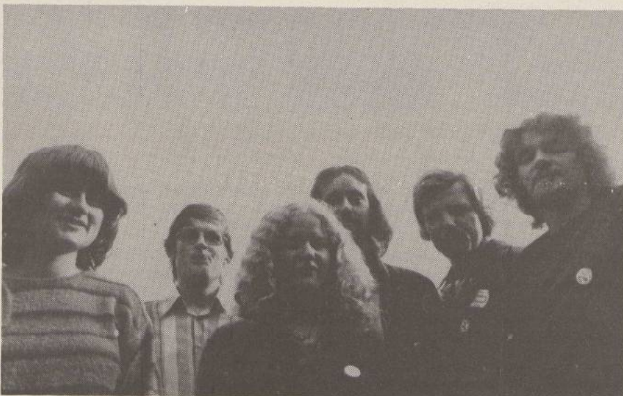
GSB- bestuur in aktie.

Ja, voor de 25 gulden dat het GSB-lidmaatschap ook dit jaar weer kost krijg je ongelooflijk veel. Allereerst is er het GSB-HBO-bond-reduktiebureau. Daar kun je allerlei zaken tegen sterk gereduceerde prijzen kopen. Geen overbodige luze gezien de krappe portemonnee van veel studenten. We verkopen daar van alles; koffie en thee, heel goedkope platenbonnen, typmachines en calculators, noem maar op. Verder ben je automatisch aangesloten bij het Reisbureau van de GSB, Studair, waarmee je goedkoop zo'n beetje de hele wereld af kunt reizen. Ook ben je automatisch aangesloten bij de boekenbeurs, en krijg je elke twee weken ons blad Nait Soez'n in de bus, evenals het maandblad Student. Verder hebben we een adviesbureau, 's maandags en dondardags van vier tot half zeven op Visserstraat 46, waar je met allerlei problemen op huisvestings- en inkomensgebied terecht kunt. Bij de GSB heb dan ook nog stencil- en offsetfaciliteiten; ik geloof dat dat het wel is. Op de faculteiten, in de akties, maar ook aan zo'n faciliteitenpakket merk je het; die vakbond is er niet voor niets. Gezamenlijk voer je akties voor beter en toegankelijk onderwijs, gezamenlijk pak je allerlei problemen aan, en als je zelf moeilijkheden hebt met bv. je inkomen kun je ook op je vakbond rekenen. Wat is er dan logischer dan lid te worden van die vakbond, de GSB. Jij hebt de GSB nodig, de GSB jou.