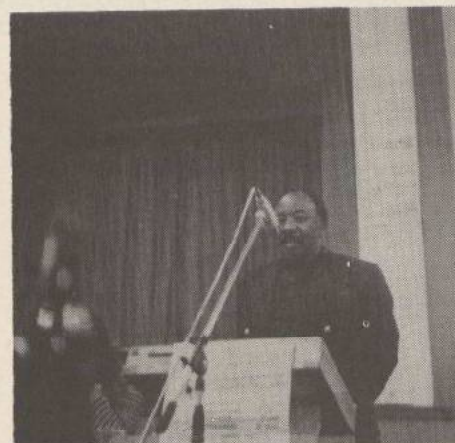
Alfred Nzo.

is er veel meer opgericht de bevrijdingsbewegingen te isoleren van de zwarte bevolking, en de internationale progressieve beweging. De politiek van de USA is er op gericht haar belangen veilig te stellen, en een (haar goedgunstige) meerderheidsregering in het zadel te helpen. Feitelijk staat ze een neo-koloniale oplossing voor, waarin de peilers waarop de apartheid nu rust, de multinationals, de grote financiële blangen van de USA en West-Europese landen, recht overeind blijven staan. Als progressieve beweging moeten we een dergelijk 'oplossing' krachtig blijven afwijzen".