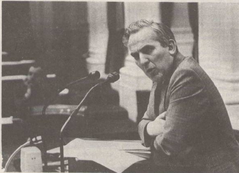
Oud- staatssecretaris Klein.

Het zal duidelijk zijn dat dit voor de GSB geen oplossingen zijn. Binnen de opgelegde kaders valt niet te plannen, mede omdat ze niet democraties vastgelegd zijn. Meewerken aan het opstellen van een ontwikkelingsplan (die geen echte plannen zijn, maar elk jaar drasties bijgesteld worden vanuit imperativen van een diskutabele soc. ekon. politiek) is het mes op eigen keel zetten. Als eind '78 de behandeling in de 2e kamer plaats vindt, zal gesteld worden dat er in nauw overleg met de universiteiten plannen tot stand zijn gekomen. Wanneer we niet nu de randvoorwaarden aanvechten dan zal de kritiek die we erop hebben niet tot het parlement doordringen. Op deze manier wordt de democratische besluitvorming ontwricht, en het W.O. afgebroken.