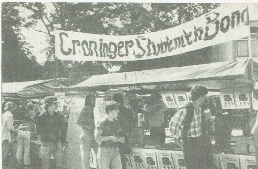
De GSB; altijd overal aktief, zoals hier tijdens de KEI.

Op deze manier zouden de mensen in de projekten aktief in de aktie in te schakelen zijn, en zoude discussie over het belang van goede wetenschappelijk onderwijs voor de bevolking, waar het bij de herstructurering voor een belangrijk deel toch om gaat, met een grotere groep mensen explicieter gevoerd kunnen worden. Probleem daarbij was echter de korte tijd van nu tot de 18e. Als ook al op de fakulteiten gewerkt moet worden aan de discussie over de gevolgen van de herstructurering voor de eigen opleiding en van de noodzaak van een groots optreden op de 18e, is er geen tijd meer voor het goed organiseren van een dergelijke studie-conferentie. Daarnaast werd er opgemerkt dat de mobilisatie naar een dergelijke conferentie makkelijk de voorbereidingen voor de 18e kon gaan hinderen, en dat is niet wenselijk. Na een lange discussie was de konklusie dat er alleen een projektenbijeenkomst met een beperkter karakter georganiseerd zou worden: over de gevolgen van de herstructurering- en m.n. de vierjarige kursussduur- voor de projekten, en natuurlijk hiermee samenhangend over het belang van het