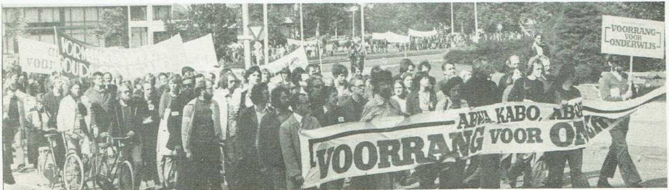
Voorrang voor Onderwijs. Dat was het thema van de actie vorig jaar tegen de bezuinigingen op het onderwijs. Wat doet de UR?

"De hand in eigen boezem" was de kern van zijn verhaal. Al dat gepraat over regeringsmaatregelen was maar flauwekul, gewoon intern de touwtjes strak aan trekken. De fakulteiten, die tezamen meer dan 100