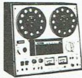
SONY RECORDER TC 378 De specificaties van dit voorname aut. jack behoren tot de besten in deze categorie. 3 Cassettkoppen, open rubriek 3, 3-geleidel. Adresvisite GSB f750,-

AKAI tapedeck GX2150... f926,75 AKAI tapedeck 4000DS... f555,- PHILIPS tapedeck N4506... f661,25 SONY tapedeck TC378... f750,-